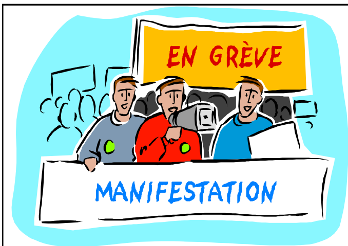
4 La Farga

¿Dónde están aquellos médicos, que en los albores de la medicina moderna entregaban sus vidas a la lucha contra las enfermedades? Los echo de menos. Los médicos que, hombres o mujeres hacían un juramento Hipocrático, han sido substituidos por otros médicos, hombres o mujeres que hacen un juramento HIPÓCRITA, anteponiendo sus intereses económicos a los intereses de un conjunto de personas, los